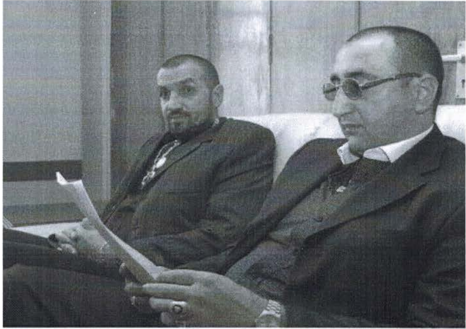
ڪم ڪوٺيو، ڏيندڙ ڏيندڙن سان، اڄ جو -